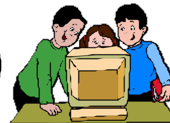
Das verflixte Computerspiel