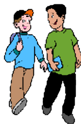
Der entscheidende Morgen